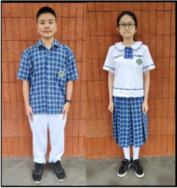
SERAGAM HARI SELASA