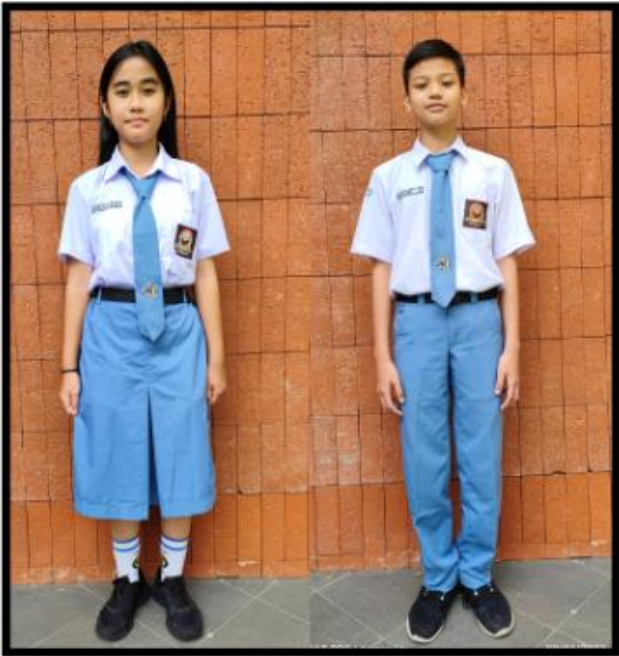
SERAGAM HARI SENIN