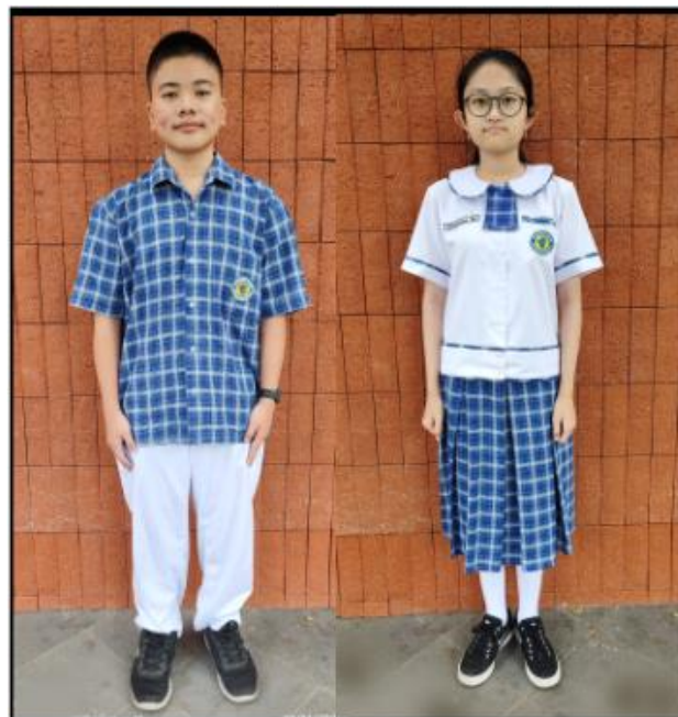
SERAGAM HARI SELASA