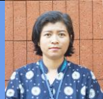
Veronica R K D, S.S