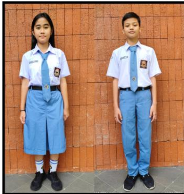
SERAGAM HARI SENIN