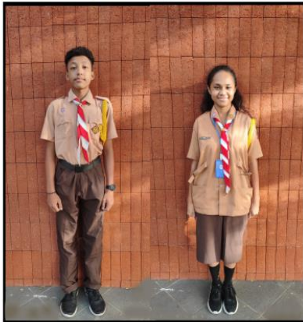
SERAGAM HARI JUMAT