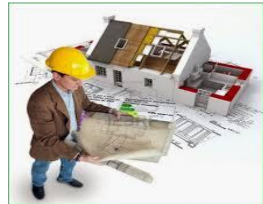
BAKAT RELASI RUANG (SPASIAL)