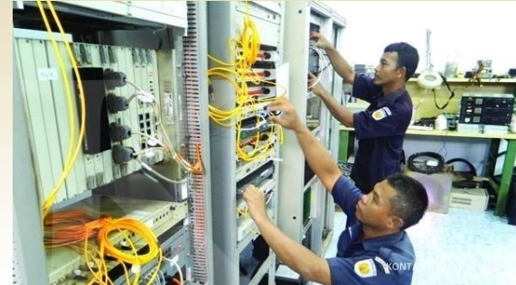
MINAT KEGIATAN FISIK